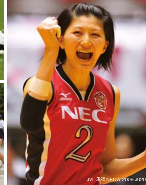
JVL 承認 NECW-2009-J020