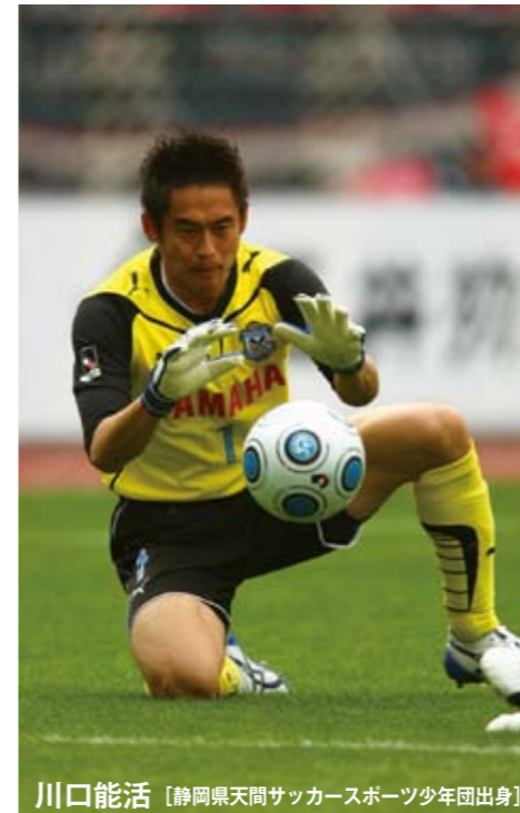
川口能活 [静岡県天間サッカースポーツ少年団出身]